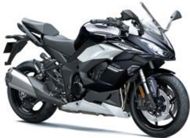
Sort med hvid (BK1)

*Modellen er vist med Tourer udstyrspakken