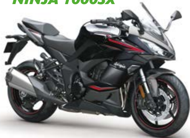
Grå/Sort med rød (GY1)