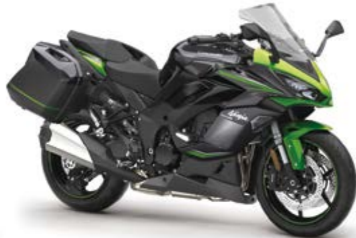
Grøn/Sort med grå (GN1)

*Modellen er vist med Tourer udstyrspakken