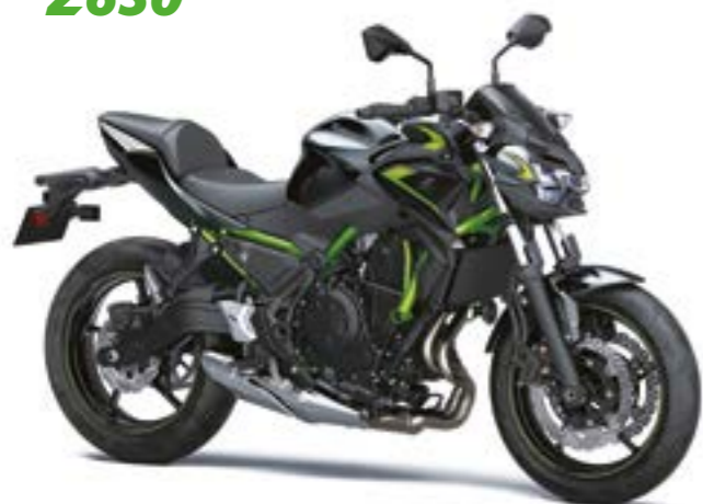
Sort med grøn (BK1)