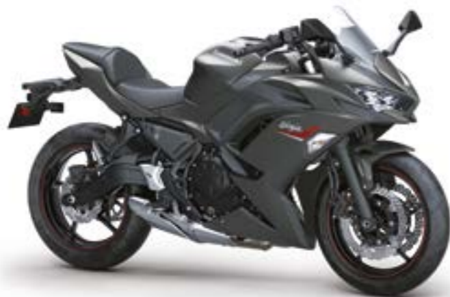
Grå/sort med rød (GY1)