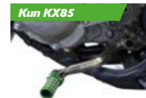
Aluminium gear pedal