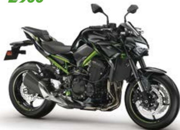
Sort med grøn (Bk1)