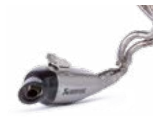
Akrapovic Sports Udstødning