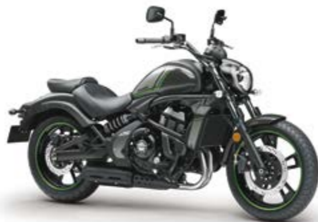
Grå/Sort med grøn (GY1)