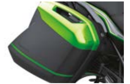
Integreret taskesystem 2x28 L