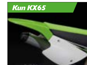
Ufo skjold - bag