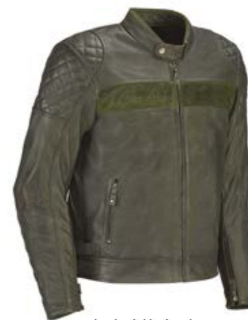
Læder Jakke London