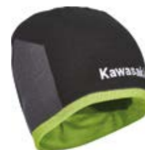
Sport Range Beanie