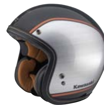
Urban-V Kawasaki Hjelm

Udviklet med fokus på komfort og stil! Hvis du er ligeså passioneret omkring motorcykellivet som vi er, går du sikkert heller ikke på kompromis med hverken kvalitet, komfort eller stil. Med originalt Kawasaki køreudstyr bliver oplevelsen endnu bedre.