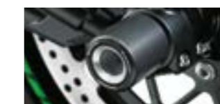
Front aksel beskytter