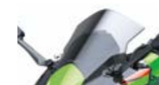
Tonet og større kåbeglas