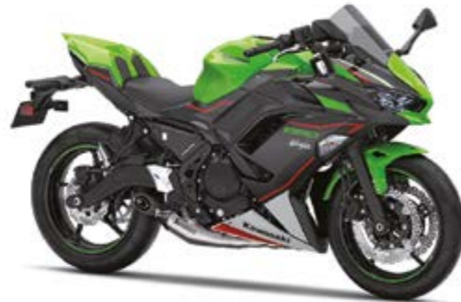
Grøn KRT (GN1)