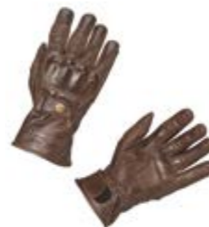
Læder handsker Bristol