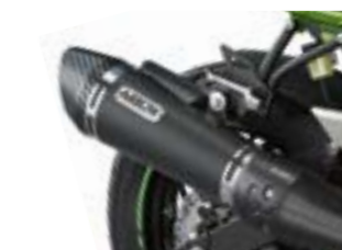
Sporty Arrow Udstødning