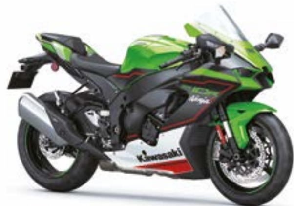
KRT grøn (GN1)