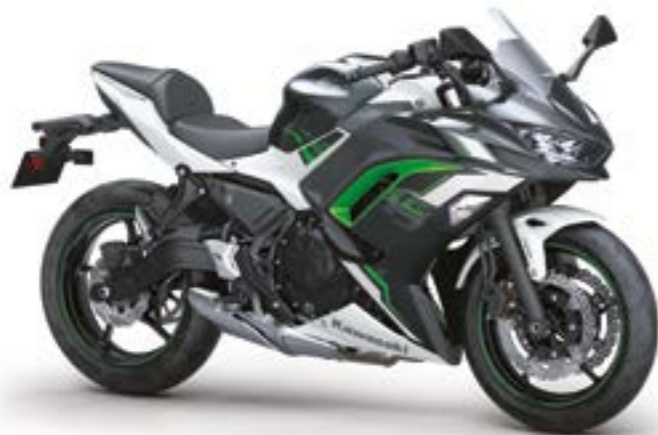
Sort/hvid med grøn (WT1)