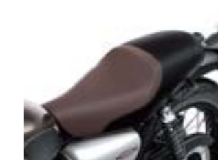
Alle W800 sæder passer til alle versioner.