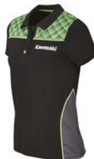
Sports Polo Lady