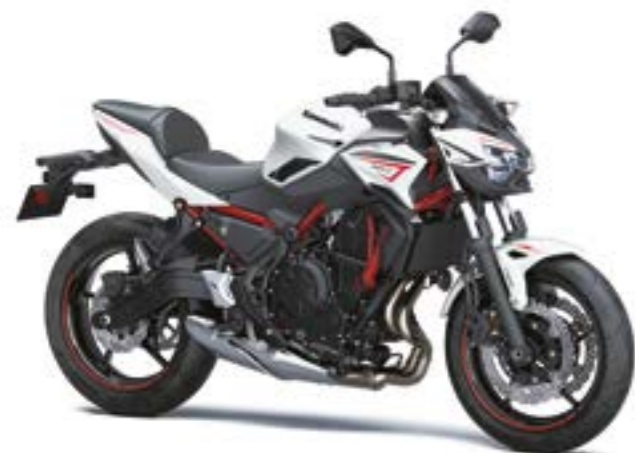
Hvid/Grå med rød (WT1)