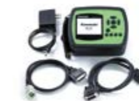
KX Fi. Tuning / kalibrerings kit