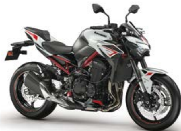
Hvid/Grå med rød (WT2)