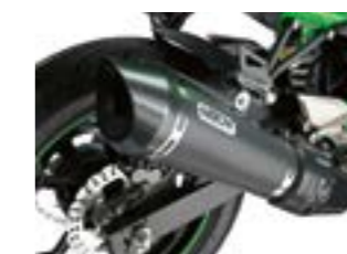
Arrow udstødning med Carbon varmeskjold