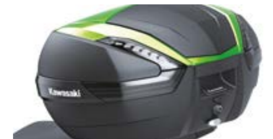
47L Top boks