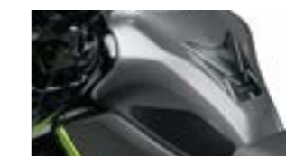
Tank & Knee Pads