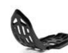
Skid plate kit