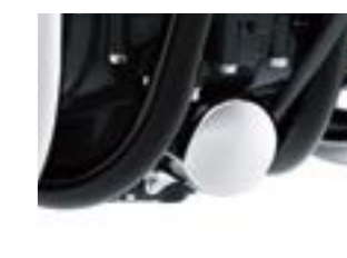
Krom olie påfyldningsdæksel