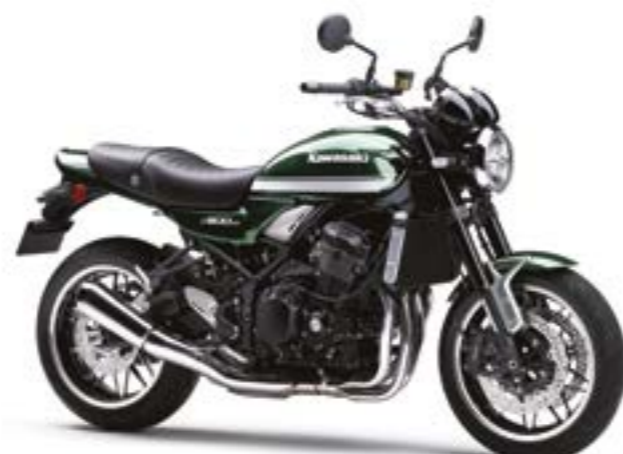
Mørk grøn (GN2)