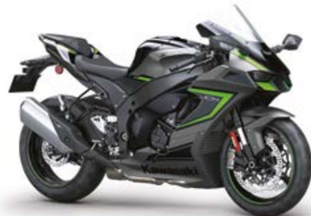
Sort/grå med grøn (BK1)