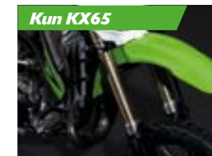
Ufo skærm - front