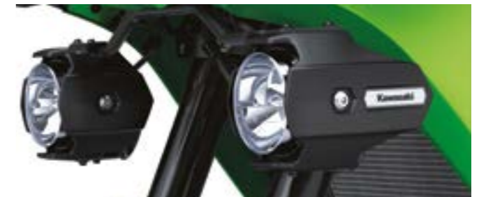
Led tåge lygter