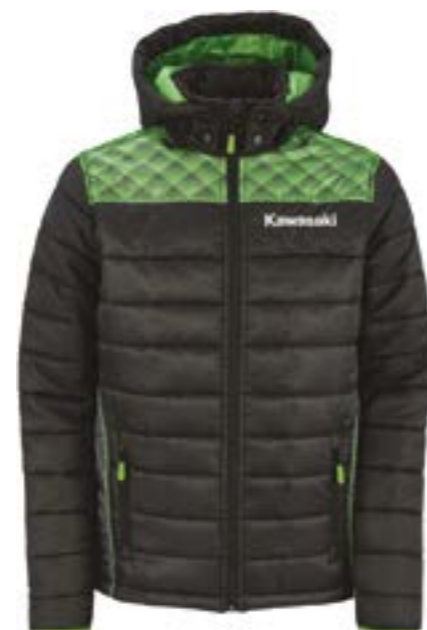
Sports Vinter Jakke

Vis din passion for Kawasaki motorcykler, med vores brede program af originalt tøj. Her kan du finde alt fra fritidstøj, til det tøj vores World Super Bike Championship team bærer.