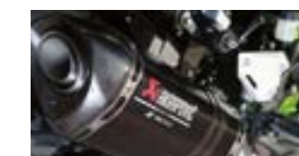
Carbon Akrapovič udstødning