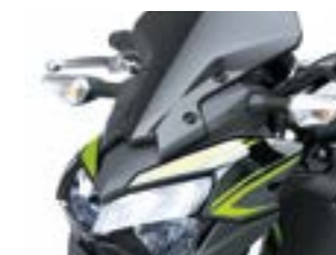
Høj vindskærm, smoke