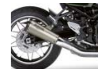
Titanium Akrapovič udstødning