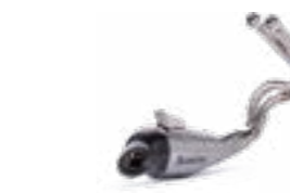
Akrapovič Titanium udstødning