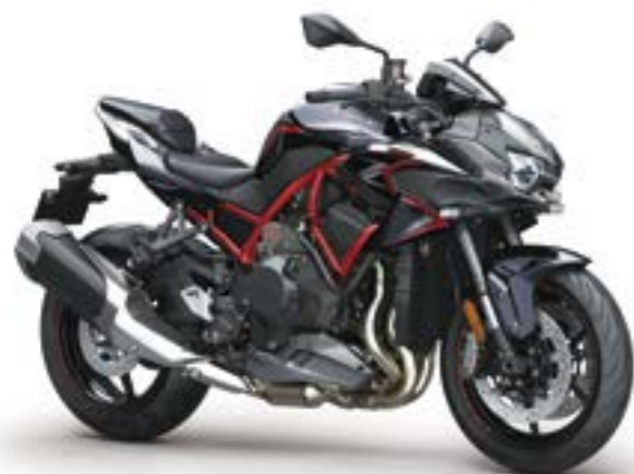
Grå/Sort med rød (GY1)

Z H2 SE vs Z H2 + Kawasaki Electronic Control Suspension (Skyhook teknologi) + Brembo forbremse + Special lakering + Armerede bremseslanger