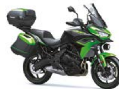
Grøn/Sort (GN1) Modellen vises med Tourer Plus udstyrspakke