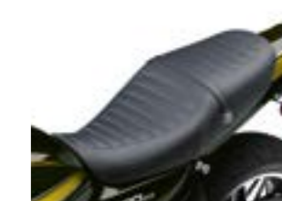
Ergo-Fit lavt sæde