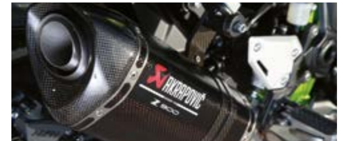
Carbon Akrapovič udstødning